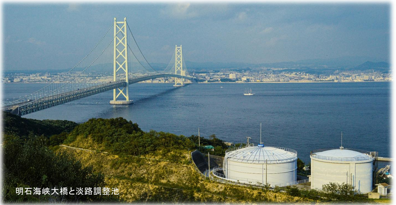
明石海峡大橋と淡路調整池